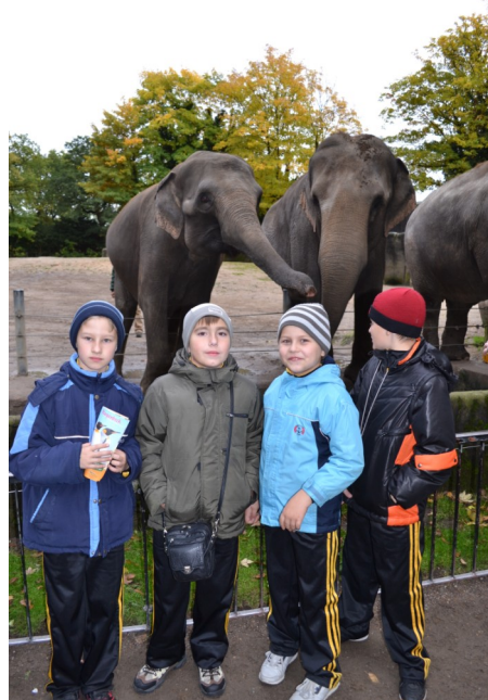
«Чипы» в зоопарке

Музей автомеханики «Prototype», который нам также удалось посетить, особенно интересен тем, что практически все его экспонаты на ходу и коллекция постоянно пополняется. Нам очень понравилось