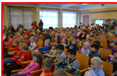
Зрители-дети д/с №№36,37