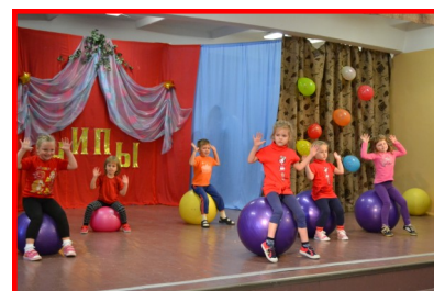
«Чипы» - дошкольники

стями. На данное шоу были приглашены самые близкие друзья группы, а также воспитанники соседних детских садов, которые ежегодно приходят разделить радость этого дня с «Чипами». Дети были в восхищении от происходящего. Их глазки разбегались по сцене, пытались уловить самые интересные и красивые