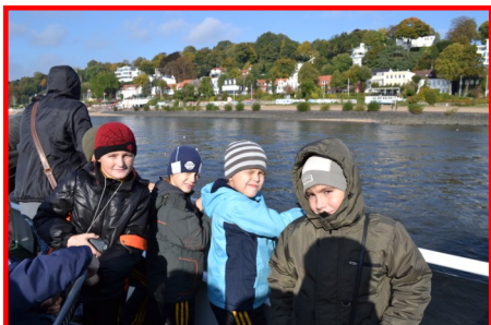
«Чипы» на теплоходе по Эльбе

Больше всего нас впечатлил зоопарк - один из крупнейших в Европе. Его территория очень большая. Нам удалось погладить слонов, поиграть с козлятами, покормить с рук оленей. Больше всего удивило то, что в зоопарке есть настоящие пингвины, морские котики и т.д. А обезьяны –