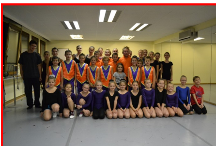
Группа «Чипы» и немецкий коллектив

это вообще высший класс! Очень много птиц, животных и очень жалко, что в нашем городе нет такого зоопарка. Если сравнить наш зоопарк по площади, то это только место жительства для одних слонов. А в Гамбурге на каждый вид животных отво-