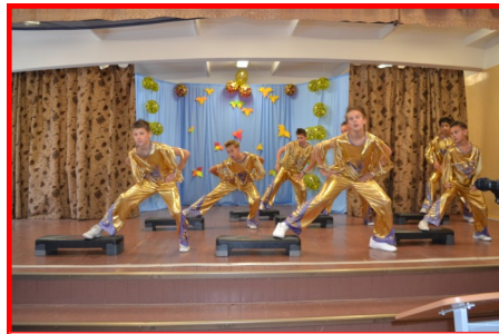
«Чипы» на открытии семинара

патриотизма через включение учащихся в проектную деятельность», который состоялся на базе нашей