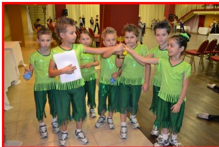
Гр. «Чипы», победители соревнований

Выступил и старший состав группы, став Лауреатом 2 степени среди юниоров. Поздравляем наших побе-