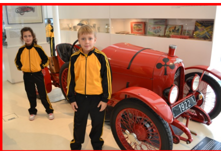
«Чипы» в Музее автомобилей

Помимо выступлений у нас была большая и интересная культурно-развлекательная программа. Мы были на трехчасовой обзорной экскурсии по Гамбургу с посещением и экскурсией по Ратуши, которая является местом заседания мэра и административных властей Гамбурга, расположенная в центре города. Поразил нас Музей миниатюры – Миниатюрная страна чудес. В экспозициях музея представлены различные темы и различные уголки нашей планеты. Здесь есть макеты с горами, железнодорожными тоннелями, стадиона-