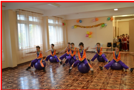
«Чипы» на «Дне учителя»

Танцевальная шоу-группа «Чипы» является постоянным участником социальных выступлений. Так,