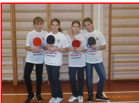
Бронзовые призеры соревнований

В рамках спартакиады Фрунзенского района в Президентских состязаниях прошли соревнования по настольному теннису. Право на участие имели ученицы 6-ых классов. От нашей школы принимала участие команда девочек из 6А класса. В