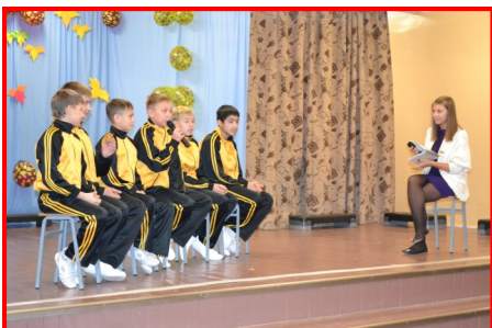
«Чипы» отвечают на вопросы

Поездка группы «Чипы» в Германию и деятельность коллектива в целом настолько стала интересна учащимся нашей школы, что ребята откликнулись на предложение дать интервью малышам. На протяжении