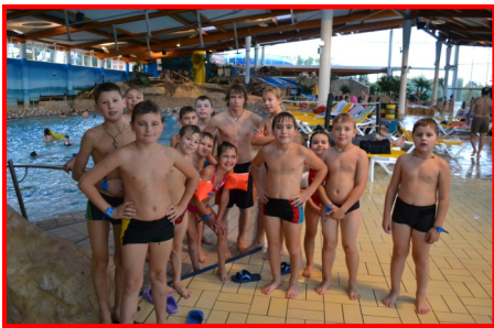
«Чипы» в аквапарке

горка была с выходом и проездом по улице. Отдохнули в аквапарке мы на славу.