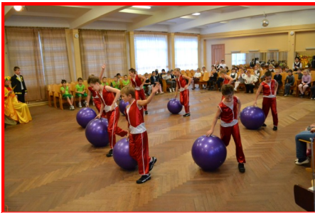
«Чипы» на «Дне осени»

26 октября - во внутришкольном празднике «День осени» с тремя танцевальными композициями, а 31 ок-