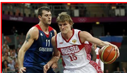
Андрей Кириленко (справа) - бронзовый призер Олимпийских Игр

и его жена Мария Лопатова. За семь лет существования Фондом было