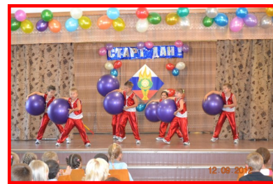
Выступление гр. «Чипы»

А самым главным событием данного мероприятия было посвящение и клятва воспитанников и педагогов клуба. Каждый ребёнок клятвенно обещал соблюдать все правила спортсмена и никогда не забывать про тренировки. Педагоги же, в