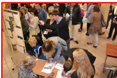
Запись в ШСК «Палестра»

1 сентября 2012 года после торжественной линейки