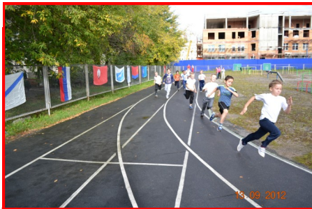
Забег 2-б класса

Новый спортивный сезон школа по традиции начинает соревнованием «День бегуна». 13 сентября на дорожке нашего стадиона вышли 248 учащихся, чтобы в зависимости от физической подготовленности и состояния здоровья преодолеть дистанцию, соответствующую своему возрасту. Бег – естественное физическое упражнение, благотворно влияющее на системы человеческого организма, поэтому по положению о наших соревнованиях, даже дети с подготовительной группой здоровья должны преодолеть дистанцию в доступном для каждого в индивидуальном темпе. А спортивные юноши и девушки, проявляя волю и характер, борются за победу и рекорды. Осо-