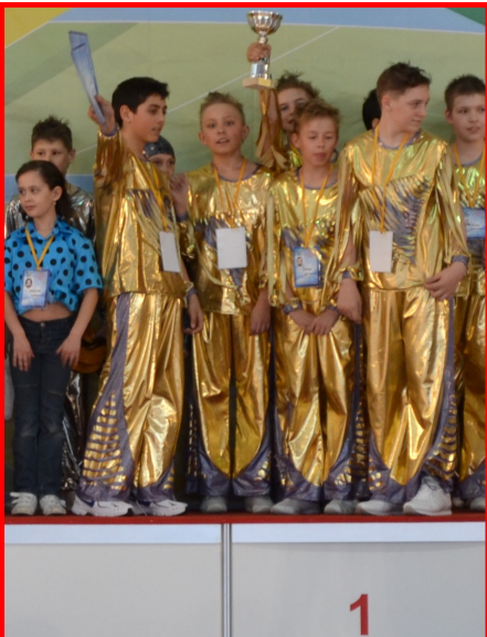
Группа «Чипы» - Победители Всемирной танцевальной Олимпиады

Сдерживая обещание, данное в прошлом номере нашей газеты, мы зашли на тренировку к группе «Чипы», чтобы задать ребятам несколько вопросов относительно их успешного выступления на Всемирной танцевальной Олимпиаде в мае