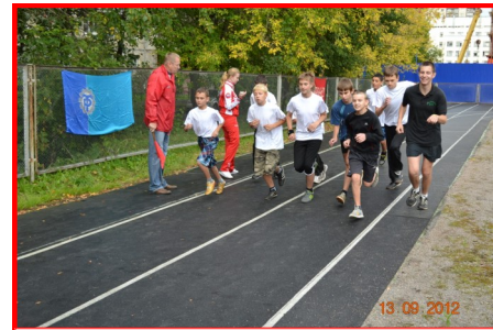
Забег 7-а класса

Порадовали, как всегда, ученики младших классов, с желанием и азартом преодолевшие трудную дистанцию 400 метров. Особенно отли-